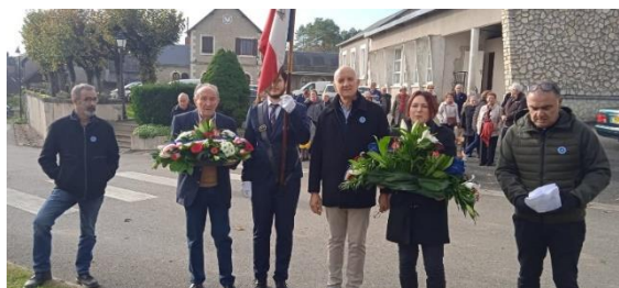
Commémoration du 11 novembre