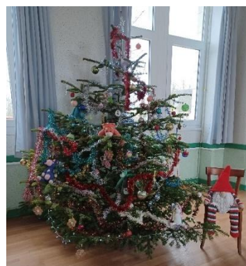
Merci à Pascale pour les doudous en crochet