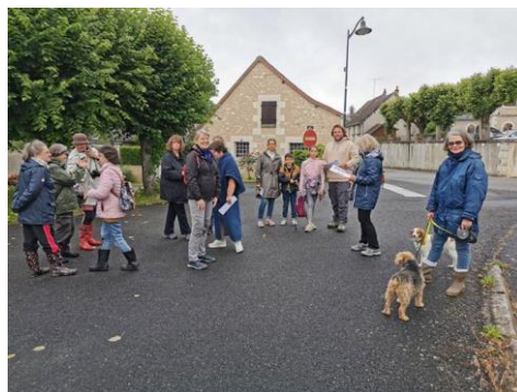
Marche du 1 er mai