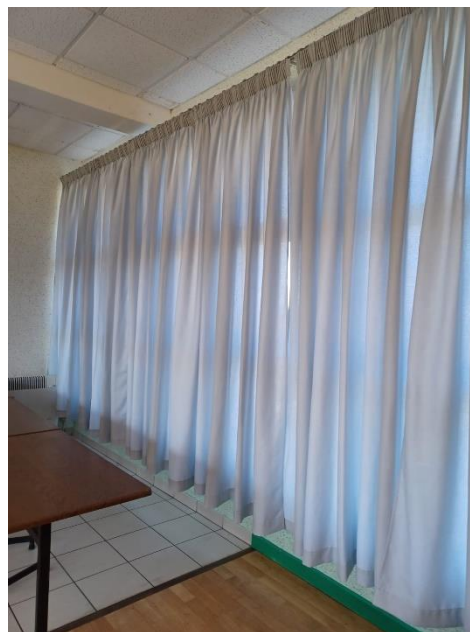
Rideaux salle des fêtes

Pompe à chaleur salle des fêtes et Mairie. Ralentisseurs. Vidéo protection. Alarmes. Remplacements matériels.