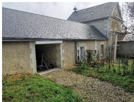
Ravalement des murs d'un logement et de la mairie