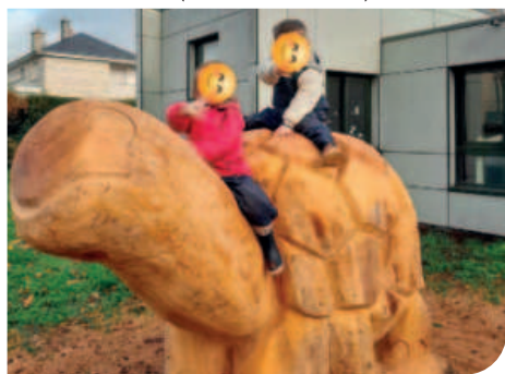
Le cèdre centenaire a laissé place à la tortue suites aux intempéries.

Le multi accueil «les petits écureuils» situé 1 rue Edouard Branly à Châtillon-sur-Indre est ouvert tous les jours de 7h15 à 18h30. Douze enfants de 3 mois à 3 ans sont accueillis quotidiennement. Chaque année des sorties sur les fermes du territoire sont organisées (Cotron, Ozance, Vautournon, la Chopière). Le tarif est fixé en fonction de vos revenus et suivant votre régime allocataires (CAF ou MSA).